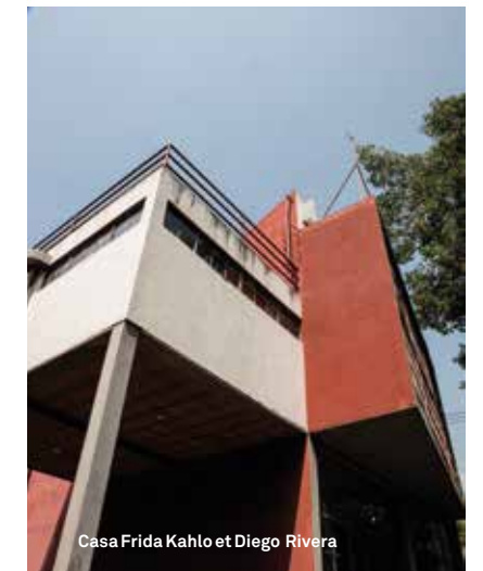
Casa Frida Kahlo et Diego Rivera