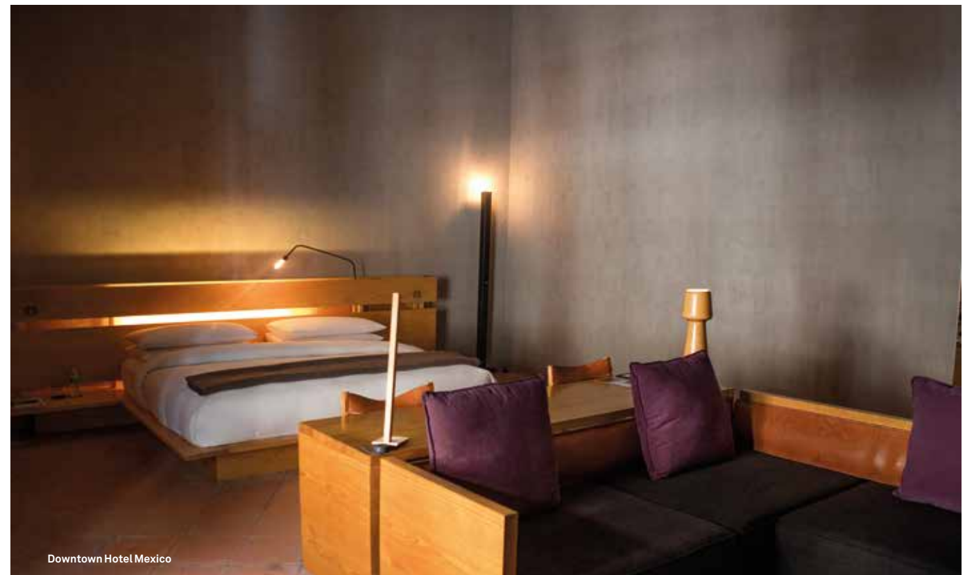
Downtown Hotel Mexico

hôtel de l'enseigne avant-gardiste Habita est la preuve irréfutable de la résurrection de ce quartier. Dans cet ancien Palacio de los Condes de Miravalle du XVII e siècle, se déploie un esprit à la fois colonial, industriel et prônant la culture locale. Le style est résolument mexicain, avec les claustras en brique rouge ou encore la grande fresque de Manuel Rodriguez trônant au-dessus du vaste escalier en pierre. Dix-sept chambres, un restaurant cosy dans un patio luxuriant à l'étage et un toit-terrasse avec vue sur les vieilles bâtisses historiques. Sans oublier la piscine et le bar où danser en mode "nuit debout". Calle Isabel la Católica 30, Centro Histórico, downtownmexico.com