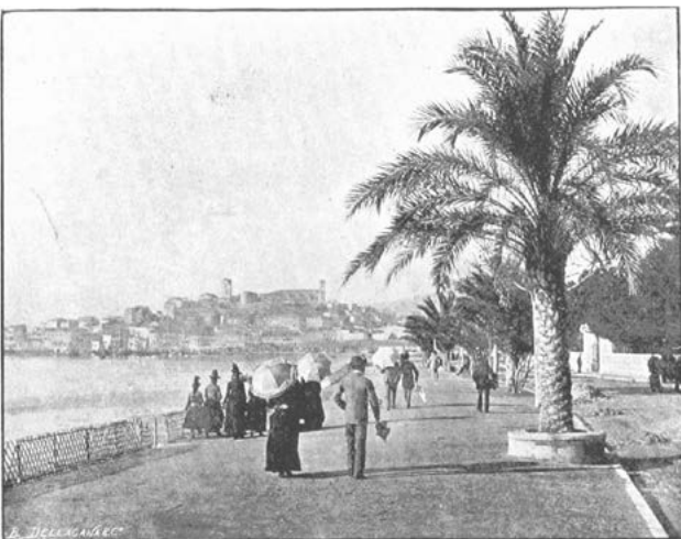
PROMENADE AT CANNES.