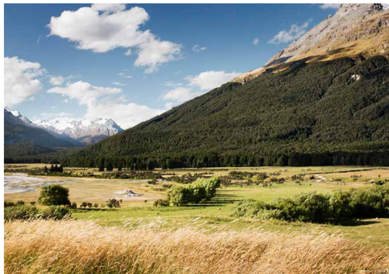
Légende olore, utem. Nem quis est laut volorep edigendel eaquamendi bea doluptatur sunt. Légende olore, utem. Nem quis est laut volorep edigendel eaquamendi bea doluptatur sunt.