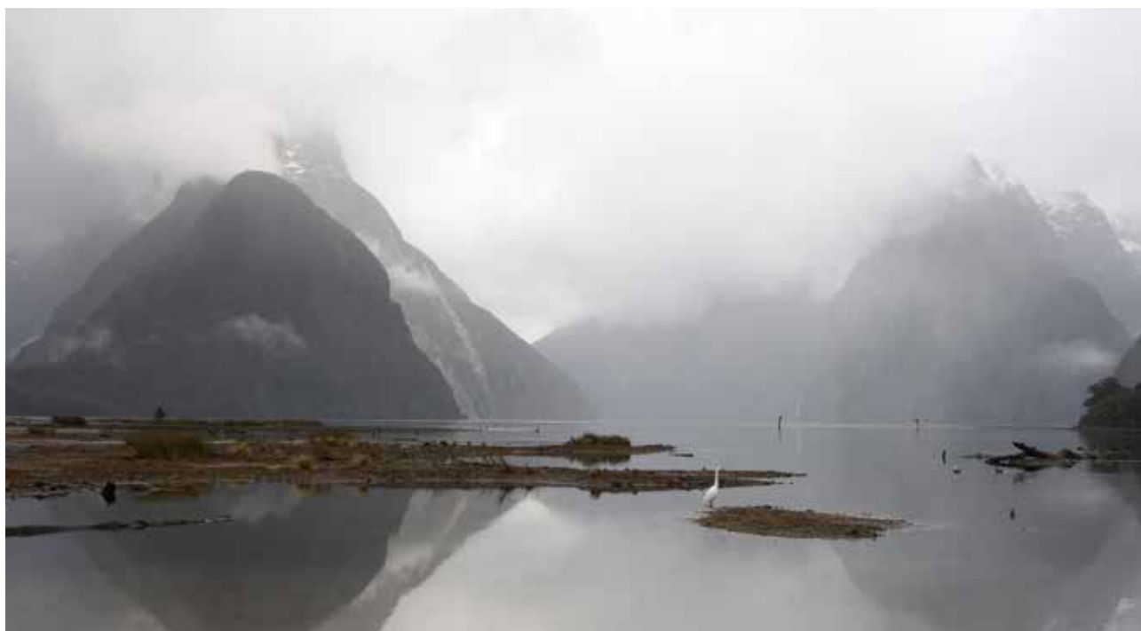
Légende olore, utem. Nem quis est laut volorep edigendel eaquamendi bea doluptatur sunt.

D e l'Île du Nord à l'Île du Sud, de la Comté à la région de Marlborough.