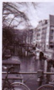
Amsterdam, à 3h30 de Paris, par le Thalys