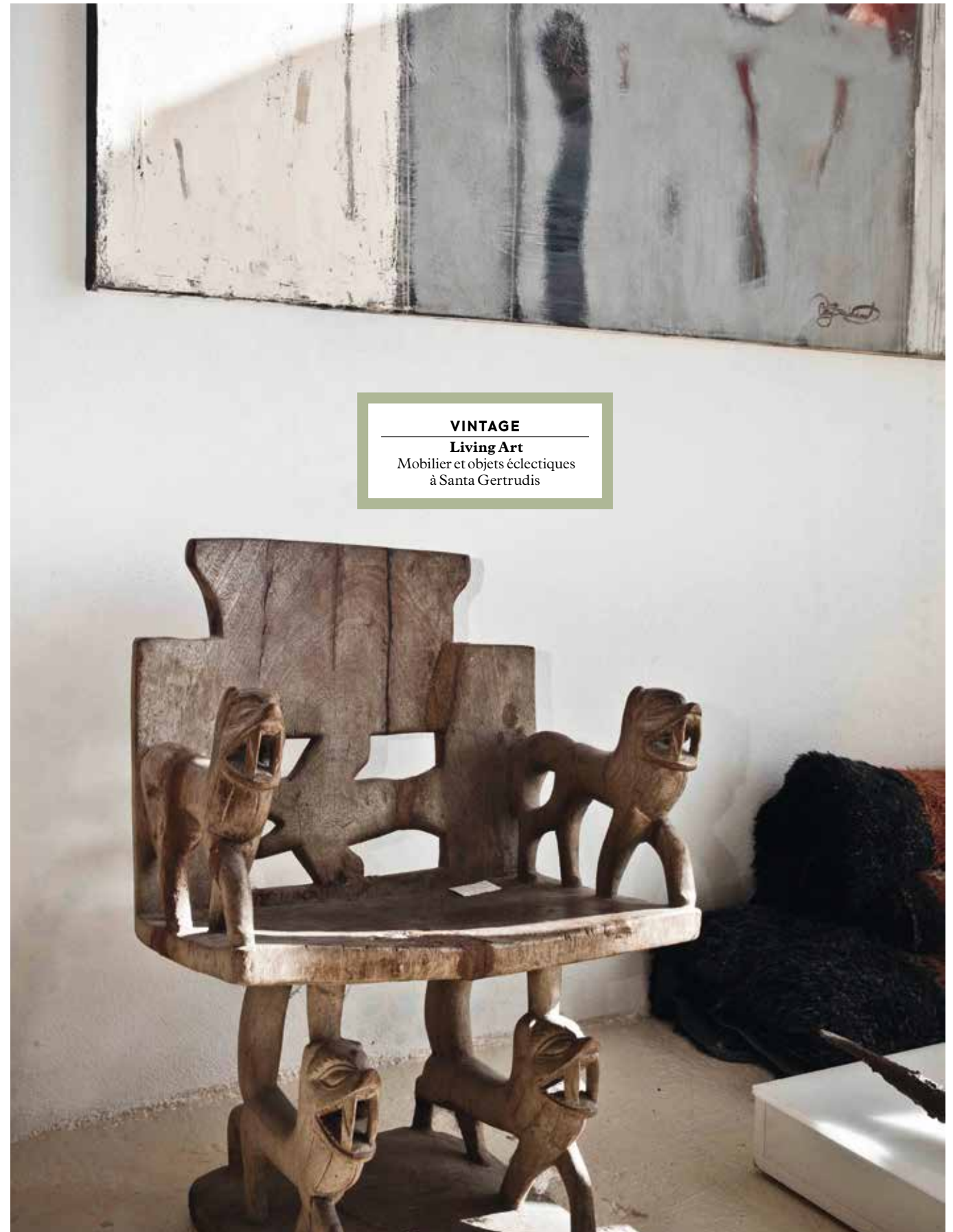
VINTAGE Living Art Mobilier et objets éclectiques à Santa Gertrudis