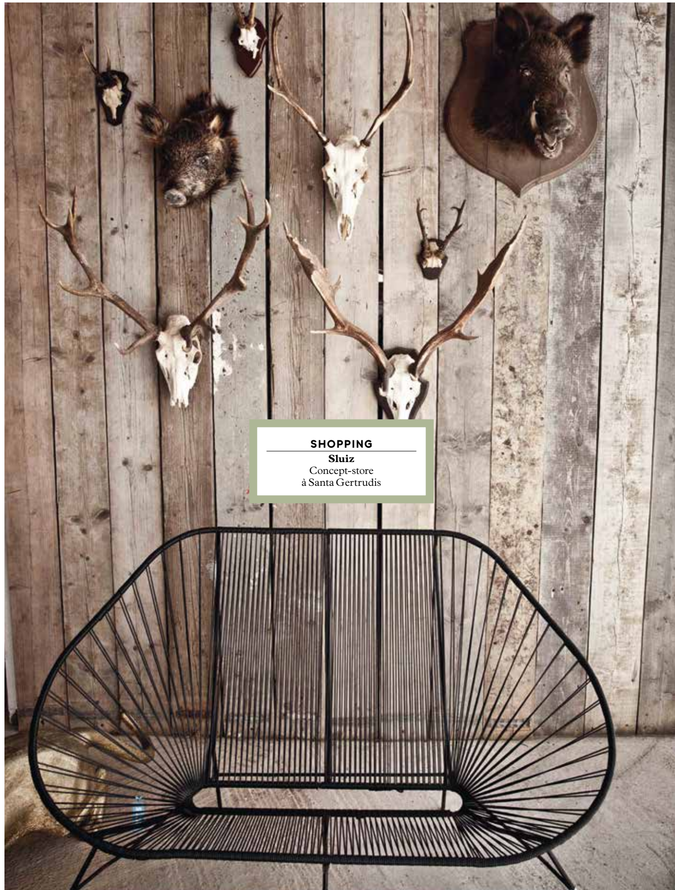
SHOPPING Sluiz Concept-store à Santa Gertrudis